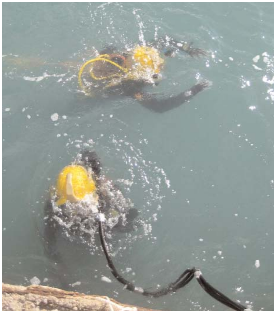
Il secondo corso annuale per OTS ricco di innovazioni e nuove specializzazioni IDSA

Il secondo corso annuale del Cedifop (settembre-dicembre 2009) per OTS (Operatori Tecnici Subacquei), iniziato pochi giorni prima del riconoscimento ufficiale del centro come full member di IDSA (International Diving Schools Association), ha presentato una serie di caratteristiche nel-