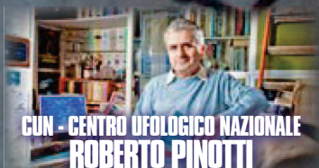
CUN - CENTRO UFOLOGICO NAZIONALE ROBERTO PINOTTI

Ripartire dal made in Italy con particolare attenzione alla nostra terra