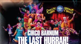
CIRCO BARNUM THE LAST HURRAH!