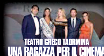
TEATRO GRECO TAORMINA UNA RAGAZZA PER IL CINEMA