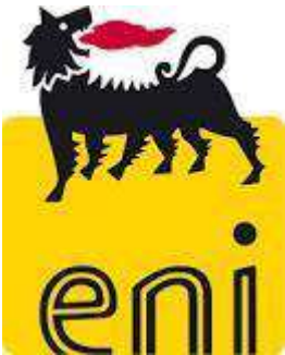
ENI e Legge 07/2016