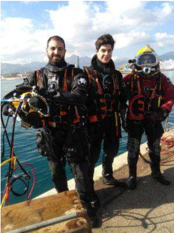
Commercial Divers in azione presso CEDIFOP Palermo