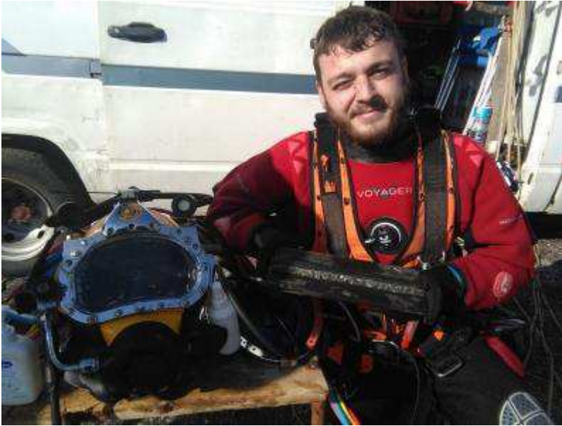
Presso Fincantieri Palermo corso di Saldatore Subacqueo