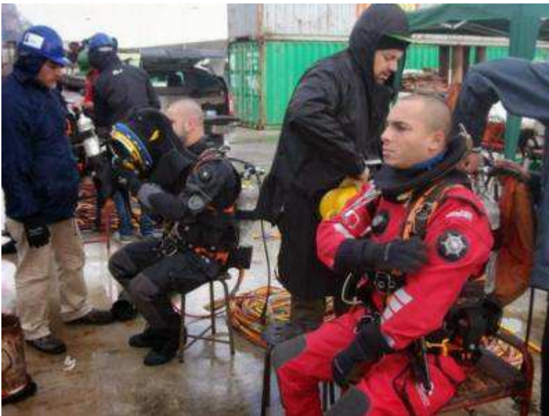
La legge 07/2016 conosciuta come Legge Lentini è operativa