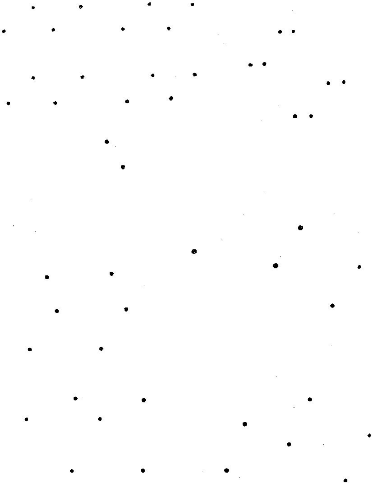
FIGURE GEOMETRICHE INTUITIVE